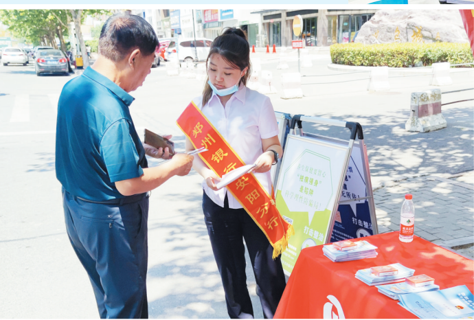
6月25日,郑州银行安阳分行深入企业、社区、商场、公园等开展金融知识集中宣传活动,讲解防范非法集资等知识,守好老百姓的“钱袋子”。

→为帮助青少年群体掌握必要的金融知识,提升风险防范意识和自我保护能力,近日,中国人民银行滑县支行按照中国金融教育发展基金会“星海计划”安排,走进多所中小学校,为青少年讲解金融知识。图为6月26日,该支行工作人员为学生发放金融知识宣传资料。