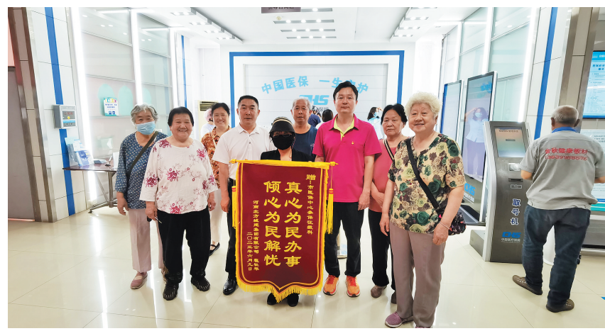
市医保中心持续开展“放管服”改革,坚持以人民为中心的服务理念,切实提高服务能力和水平,获得群众好评。图为6月22日,几位市民专程到市医保中心服务窗口送锦旗。

度,始终绷紧安全稳定这根弦,以“时时放心不下”的责任感,抓好风险防控工作;要不定期进行金融机构突发事件应急演练,并根据演练中存在的问题,修订完善突发事件应急预案;每位员工都要熟练掌握突发事件应急的流程、职责等,切实提高应急能力。