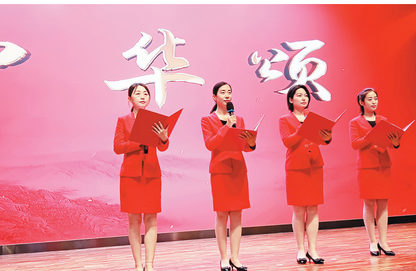
—6月27日上午,安阳市高端装备制造产业集群竞赛暨第九届“同兴杯”职工技能比武大赛在河南鑫泰能源有限公司举办。

此次比赛充分展现了我市职工昂扬向上、奋发有为的精神面貌,进一步团结引领广大职工听党话、跟党走、跟党走,充分发挥工人阶级主力军作用,为安阳建设现代化区域中心城市贡献力量。