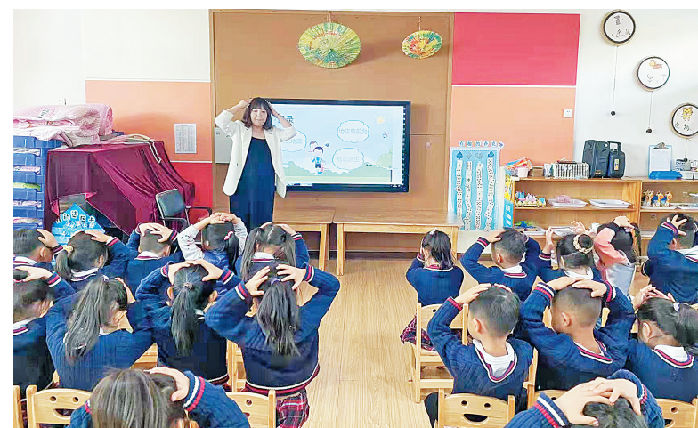
5月12日是我国第十五个全国防灾减灾日,主题是“防范灾害风险 护航高质量发展”。北关区直幼儿园根据幼儿年龄特点开展了防溺水、交通、传染病防治、防洪、防震等不同主题教育活动。图为该园老师对幼儿进行防震知识教育。

此次防震疏散演练,是一堂真实情景下的安全教育课,增强了全体师生的安全自救防护意识,提高了灾难发生时的逃生能力。该校将以此为契机,进一步加大安全宣传教育力度,加强安全管理,为学生快乐成长提供安全和谐的校园环境。