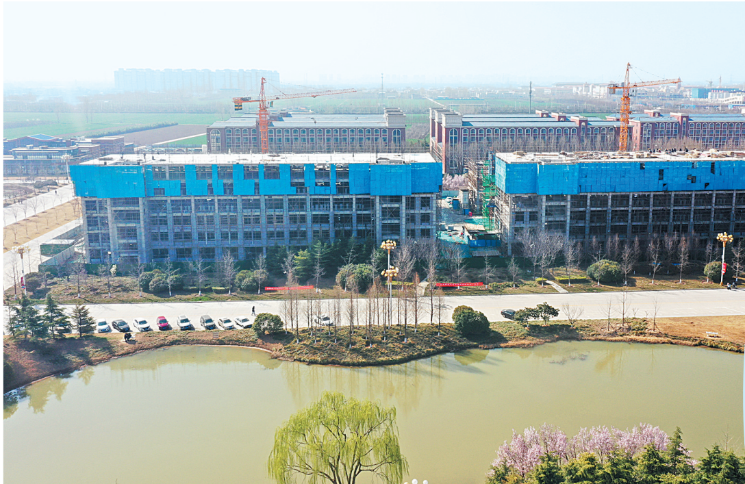
安阳学院新建教学楼群项目建设现场