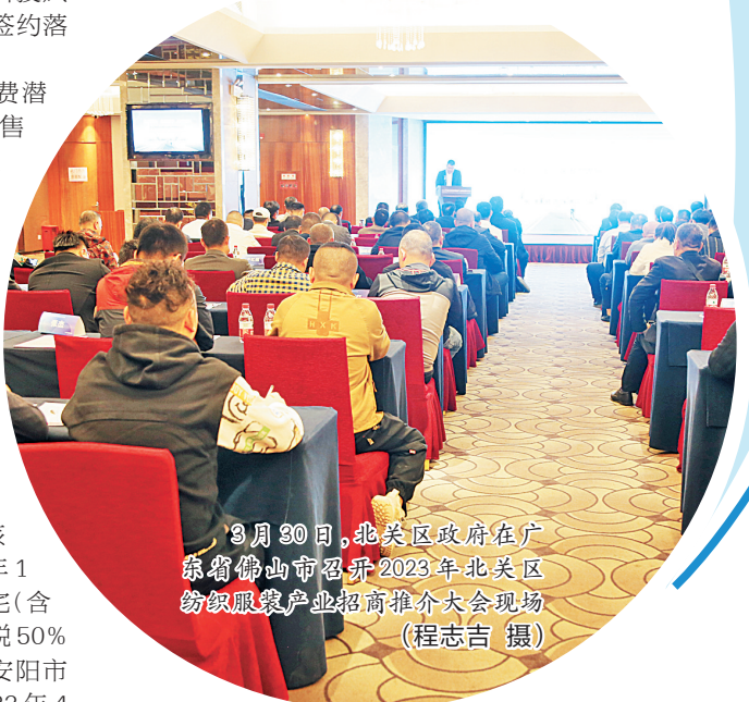
3月30日,北关区政府在广联省佛山市召开2023年北关区纺织服装产业招商推介大会现场

今年是北关区的“招商引资年”“投产达产年”。全区上下抖擞精神,聚焦签约、开工、投产三大关键环节,实干、苦干、巧干,全力以赴“拼经济”。