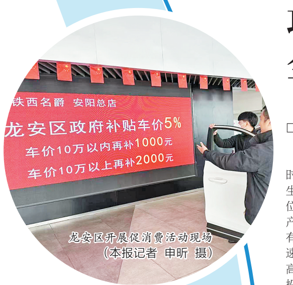
龙安区开展促消费活动现场

龙安区产业发展、项目建设一线不断“升温”,各行业、各领域、各战线不约而同擂响“奋进鼓”,按下“快进键”,跑出“加速度”,确保年度目标如期实现、顺利实现、超额实现,竞进拼抢赢新局。