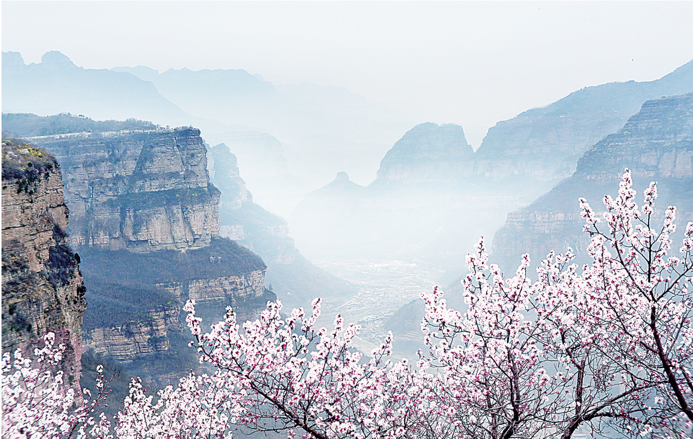
桃红又见一年春