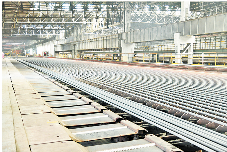
沙钢永兴轧钢厂精整区域成品现场

在沙钢永兴轧钢厂车间,火红的钢坯从加热炉中呼啸而过,经过生产线到达冷床,生产人员介绍,这是该公司今年刚开发的新品Φ50mm大规格圆钢。今年,该公司以产品结构优化为抓手,加快新品