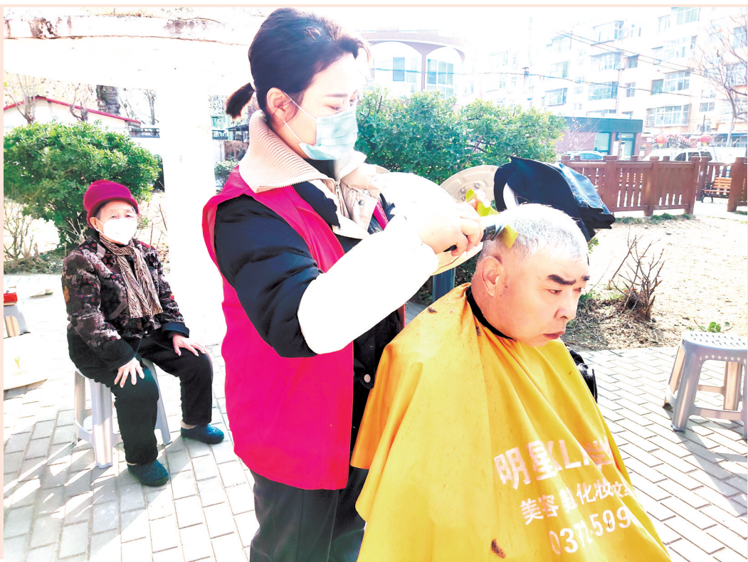
近日,文峰区东关街道育才东社区联合安阳红飘带公益组织志愿者开展了“关爱老人 免费理发”志愿服务活动。志愿者娴熟的技术、贴心的服务连连被老人称赞。下一步,育才东社区将继续为辖区居民提供各种便民惠民服务,不断增强居民群众的幸福感、获得感。