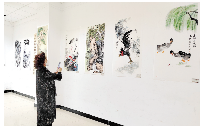
3月8日,“巾帼秀丹青——春暖花开安阳市女子书画作品展”在市文化馆(东区馆)、美术馆开幕。此次展览展出我市各个行业、不同年龄女性同胞的中国画、书法作品60余件,展示近年我市女性美术、书法爱好者的创作水准和作品感染力,传达我市女性在社会发展进程中追求幸福,发现美、创造美的精神风貌。

近年,安阳县积极探索建立关心、关爱道德模范的长效机制,帮助道德模范和先进典型解决实际问题,从政治上、工作上、生活上关爱帮扶道德模范,解决他们的实际困难,在安阳县营造崇德向善、见贤思齐、德行天下的浓厚氛围,推动形成崇德明礼的社会风尚,让传承善良、传递善举的道德观念蔚然成风。此次免费健康体检是安阳县礼遇道德模范政策之一,下一步,安阳县文明办将继续在乘坐公交车、参观游览等活动中落实对道德模范的关爱帮扶措施。