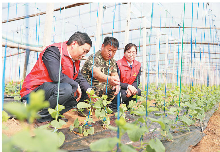
客户经理到大棚了解信贷资金使用情况及查看甜瓜长势

在今年的支持春耕生产工作中,内黄县农信社把支持春耕备播的办法措施和进展情况及时主动向当地党委、政府进行汇报,征求意见、听取建议,同党委、政府的总体工作部署保持步调一致。开展以“扫市场”“扫商圈”“扫楼道”和“进社区”“进村庄”“进工厂”“进学校”