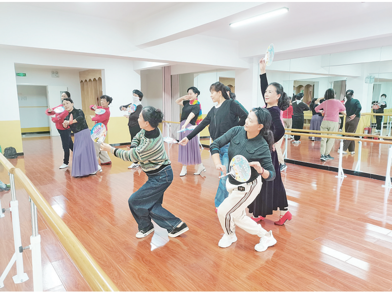
居民正在上舞蹈课

据了解,近年,该街道为满足群众日益增长的文化需求,丰富居民的精神文化生活,弘扬社会正能量,积极为辖区居民营造良好的学习氛围,