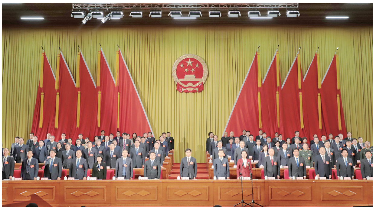
市十五届人大一次会议闭幕会现场

会议依次通过了安阳市第十五届人民代表大会第一次会议关于《政府工作报告》的决议;关于《2022年国民经济和社会发展规划执行情况与