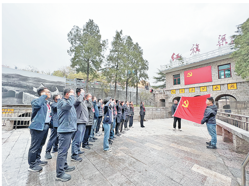
市烟草专卖局(公司)组织党员干部到红旗渠分水闸开展主题党日活动(资料图)

草专卖局(公司)以党建统领工作全局,将党支部建设落细、落小、落实。该局围绕“做什么、怎么做”,明方向、立标准、抓落实,抓实抓好党员教育管理,推进“三会一课”、主题党日、民主生活会、组织生活会、民主评议党员、谈心谈话等制度落实到位;创新党组织线上“微学习”新模式,及时发布党建工作提示、分享学习资料和工作动态,开展交流研讨。