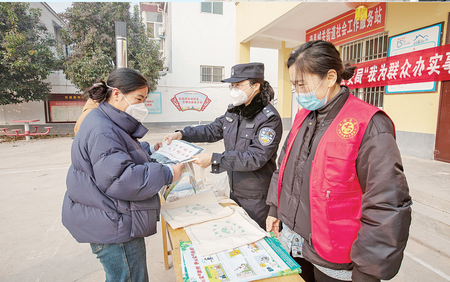
←为进一步提高辖区居民安全防范意识,守护群众“钱袋子”,12月13日,滑县公安局民警到城关镇赵庄村开展“我为群众办实事 防范电信诈骗进乡村”宣传实践活动,现场发放宣传资料,并为群众讲解防范电信诈骗知识。