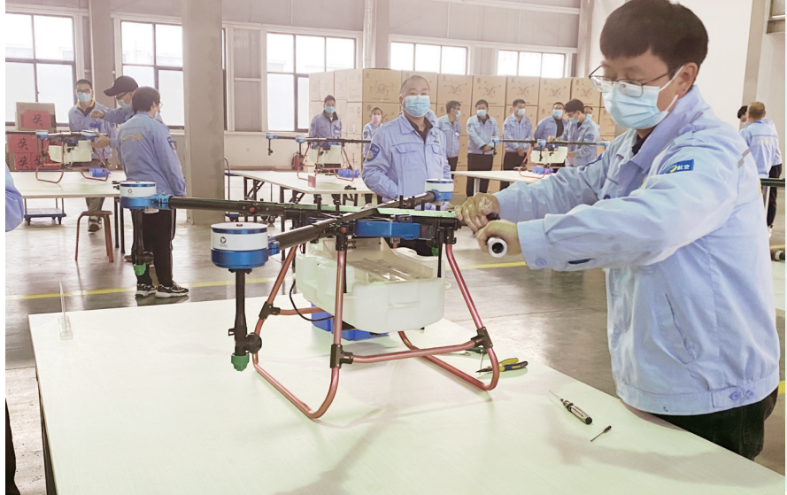
11月4日,安阳市2022年度“百万职工大比武”技能竞赛暨全丰航空无人机组装与维护竞赛决赛在安阳全丰生物科技有限公司举行。此次竞赛分为理论考试和实际操作比赛两部分,8名进入决赛的参赛选手沉着答题,展现出扎实、专业的理论功底。在实际操作比赛现场,参赛选手全神贯注,在规定时间内,完成了技能操作任务。评委们从植保无人机线路焊接、拆装组装、理论考核3个方面进行综合打分,最终评选出一二三等奖。