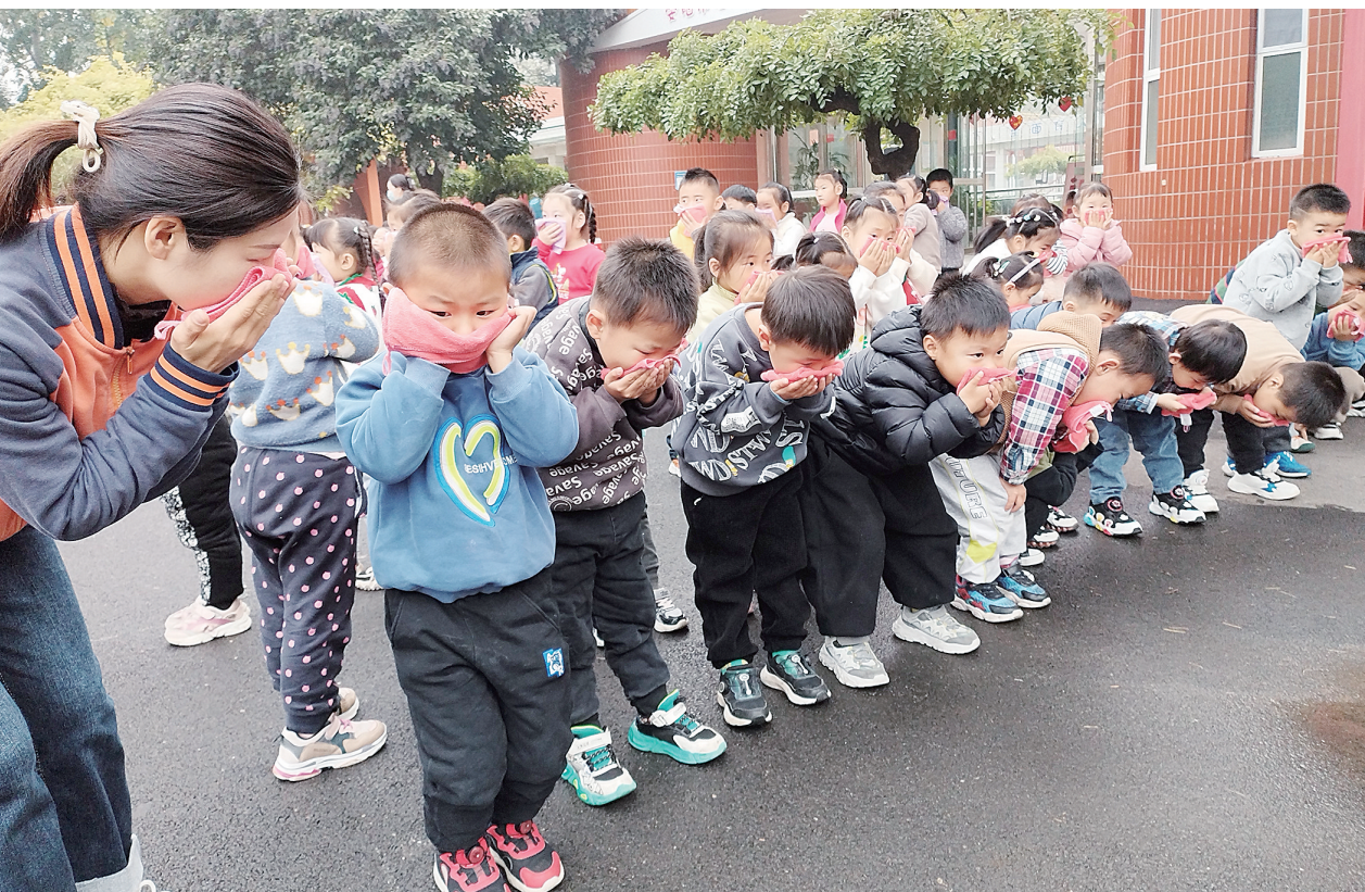
11月9日下午,市妇女儿童活动中心幼儿园开展了“消防安全总动员”疏散演练活动,巩固幼儿所学的安全防护知识,提高大家对突发事件的应变能力。