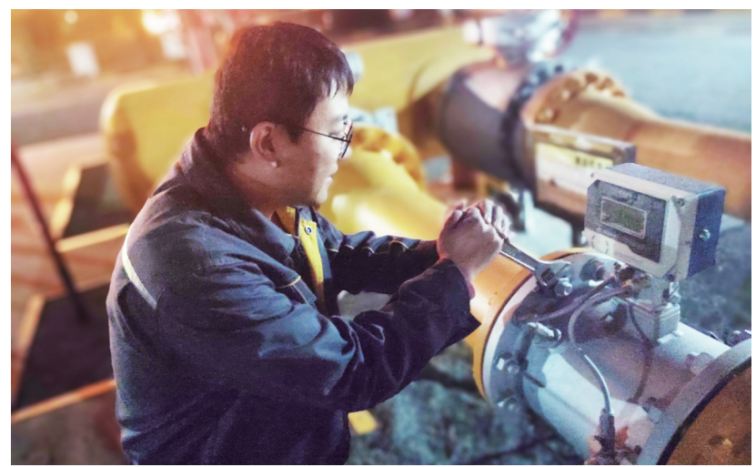
汤阴华润燃气工作人员夜里加班加点为企业紧急供气

今年2月,为确保企业复工复产用气安全,汤阴华润燃气安排专员上门对工业用户燃气设施进行全面安全检查,检查无问题后及时开阀送气,使企业尽快复工复产,最大限度减少疫情影响,为保持经济平稳健康发展贡献力量。这样的“华润速度”,是该公司上下不断优化营商环境的成果,更是始终秉持“以客户为导向”的初心,不