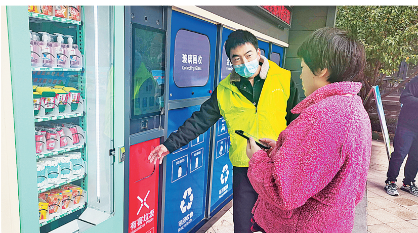
宣传员在恒大城小区介绍新建的智能垃圾分类房