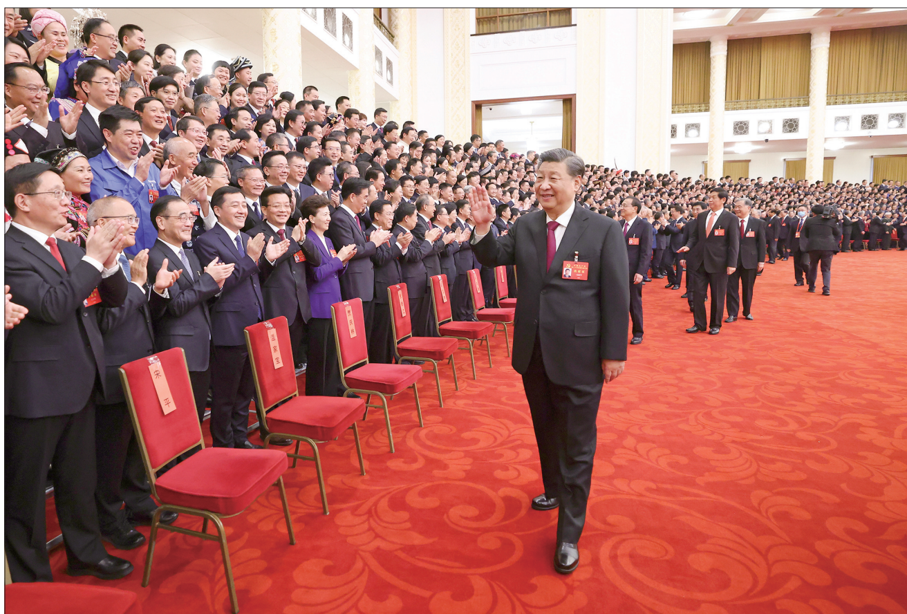
10月23日下午,中共中央总书记、国家主席、中央军委主席习近平等领导同志在北京人民大会堂亲切会见出席党的二十大代表、特邀代表和列席人员,并同大家合影留念。