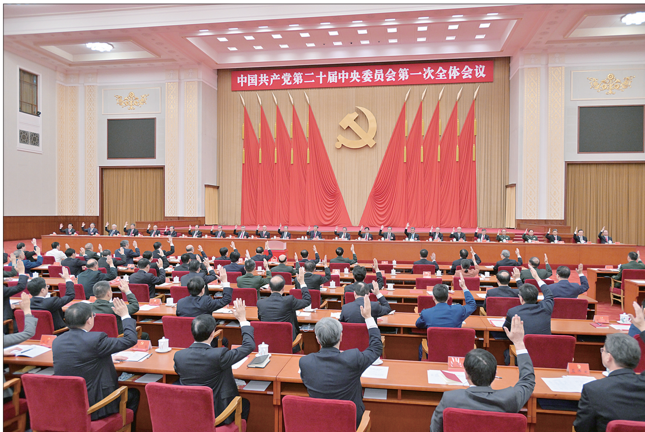
左图 10月23日,中国共产党第二十届中央委员会第一次全体会议在北京人民大会堂举行。习近平同志主持会议并在当选中共中央委员会总书记后作重要讲话。