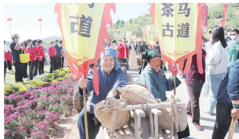
国庆节期间，“菊花之乡”林州市茶店镇举办菊花文化旅游节，人们在乡村田园赏菊花、观民俗、住民宿，乡村旅游异常火爆。

“我们举办了一系列重阳节庆祝活动，还专门为65岁以上的老人准备了节日礼品，让老年人充分感受社会的温暖和关爱。这些活动拉近了小区居民的距离，更好地传承了敬老爱老的传统美德。”桂花居永盛物业经理刘军利说。