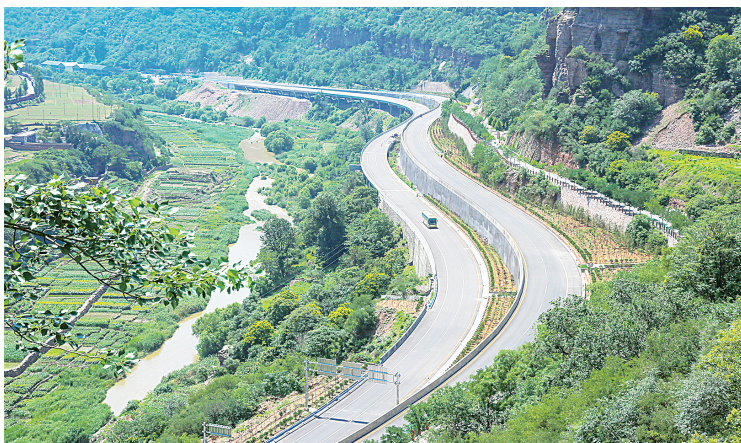
俯瞰国道234安阳线林州段

截至目前，林州市境内6条国、省干线公路全长299.401公里，干线公路通行环境得到极大改观。到“十四五”末，干线公路将形成“三纵五横”新格局，届时，一个省际交汇区域高水平交通强市将基本成型。“十年来，在推动干线公路蝶变过程中，我们充分发挥公路先行官作用。一是坚决树牢‘项目为王’理念。坚持高起点谋划、高标准实施、高效率推进，总投资超40.7亿元，新建、改建、扩建干线公路里程336.7公里，建设里程较十年前增长3倍。二是积极拓宽投融资渠道。创新项目融资方式，采用PPP模式，推进旅游通道安林路、翟阳线、黄华大道升级改造；积极‘跑部进厅’，加大向上争取资金力度，向上争取项目