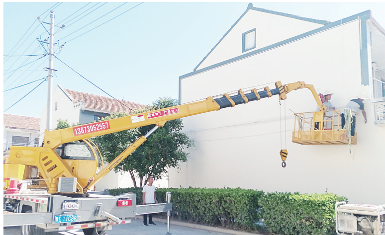
施工人员正在对村民房屋的外立面进行改造

我们的任务,又契合了马店村广大群众对美好生活的期盼。”安阳市乡村振兴局开发指导科科长杨文峰说。活动之初,市乡村振兴局邀请市城镇规划设计有限公司对马店村进行了村庄整体规划,同时还成立高规格专班,全体干部职工分为4个帮扶小组,每周五前往马店村参加义务劳动。