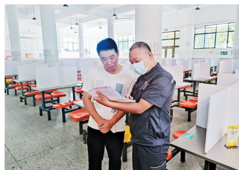
工作人员向学校食堂后勤人员耐心讲解安全用气常识