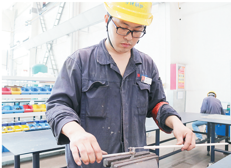
工人正在制作燃烧器点火组件探针

方快锅炉还建立了会员大会、职代会、常委会以及工资集体协商和薪酬小组运行机制,充分向员工