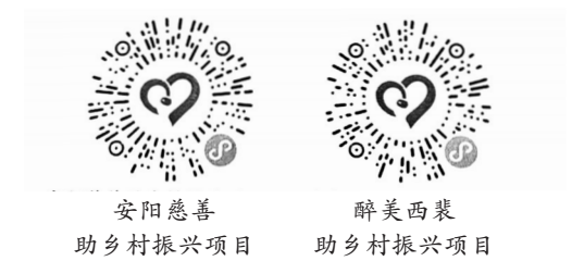
安阳慈善助乡村振兴项目 醉美西裴助乡村振兴项目