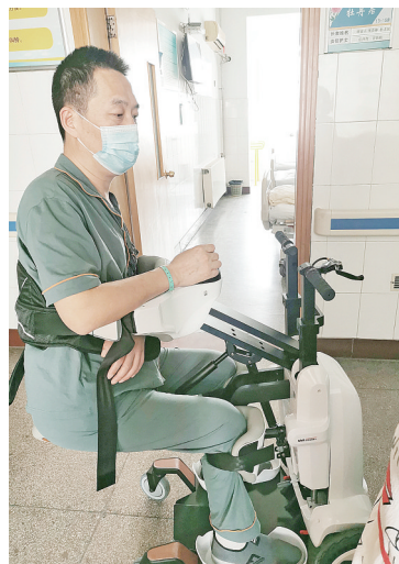
患者操作智能辅助移动机器人

“自从丈夫生病后,好久没见他这么高兴了,多亏了这个智能机器人。感谢市第三人民医院神经内科三病区的医护人员,他们真的是尽心竭力让病人康复。”患者家属激动地说,“看着丈夫病情一天天好转,而且心情也在一天天变好,我们更加坚定了康复的信心!”