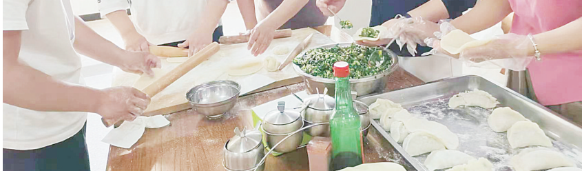
6月2日,市光华学校组织全体教职工包菜角和粽子。随着一个个形态各异的菜角和粽子火热出炉,大家边品尝美食边交流制作心得,体验劳动的快乐。