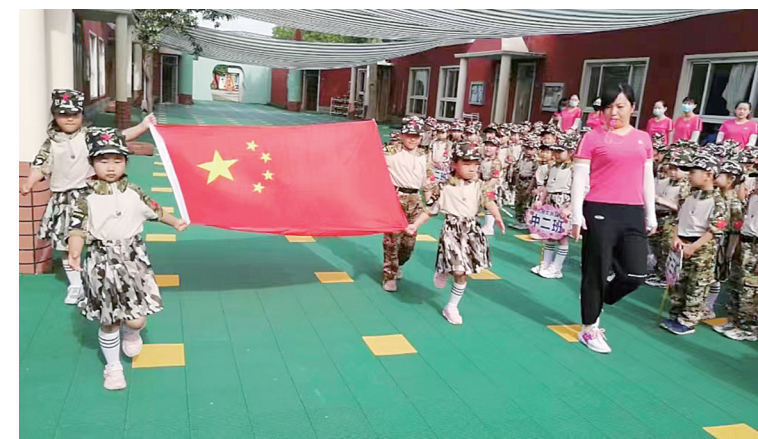
5月31日,九府文昌幼儿园举办了“少年强国、筑梦航天”运动会。孩子们身穿军装,迈着有力的步伐,昂首挺胸入场。运动会上,精彩的航模表演和丰富的游戏环节让孩子们兴奋不已。

绘美好的生活。活动中,小班、中班和大班的孩子以不同的游戏方式为幼小衔接做准备。大班以幼小衔接中的4项准备活动为抓手,开展了“我是全能小达人”自主游戏挑战活动;中班各场馆丰富多彩的“我是科技小达人”科技小制作深深吸引着孩子们好奇的目光;小班提高生活自理能力的“我是生活小达人”比赛开始了,孩子们跃跃欲试、激情高涨。