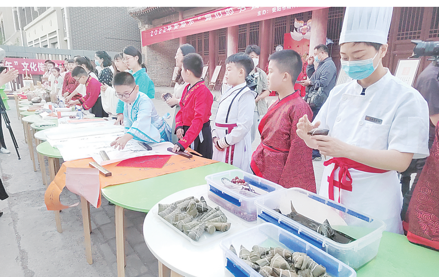
文化传承体验活动现场

走出市第一实验小学,穿过古色古香的县前街,在老相州院内,又是另一番热闹的景象。红红火火的鼓鼓表演过后,