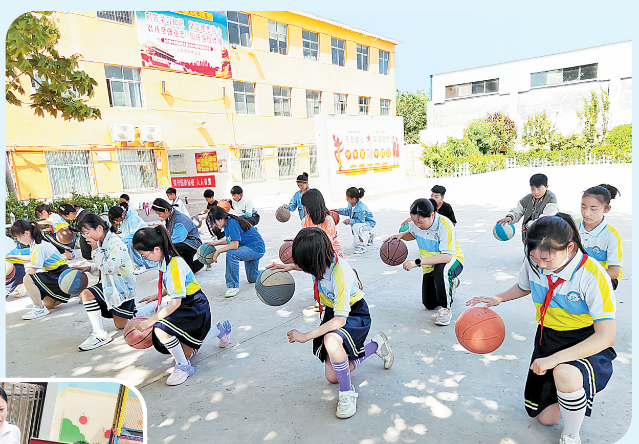
↑为进一步丰富校园文化生活,激发师生工作、学习的热情,培养学生健康的审美情趣,5月24日至26日,韩陵镇梁贡小学举办以“释放校园魅力,展艺术节风采”为主题的首届校园文化艺术节。活动包括节目展演、拉歌比赛、书法比赛、经典诵读、篮球操及投篮活动、趣味运动会等。图为学生在表演篮球操。

5月19日,永和镇“万人助万企”工作专班深入辖区企业开展“万人助万企”活动,帮助企业纾困解难,同时,还针对当前疫情防控形势进行专项督导,督促企业认真落实防疫管控相关工作,确保疫情防控和生产发展两不误、两促进。图为永和镇“万人助万企”工作专班深入企业了解生产经营及防疫情况,为企业排忧解难。(本报记者 姜蕴真/文)