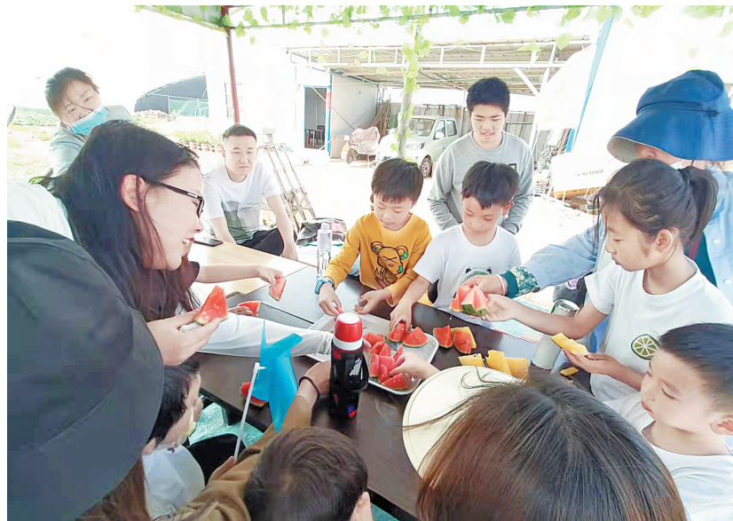
小学生们在西裴村参加农耕研学

为使西裴村乡村振兴产业发展主动对接市场,挖掘增值潜力,激发发展活力,在镇政府的大力支持下,西裴村邀请农道联众(北京)城乡规划设计研究院负责西裴村的产业发展进行运营管理。该公司根据西裴村的地理位置、文化底蕴和果蔬大棚等优势,与安阳国旅等旅游公司合作,以农耕研学团队引入客流,实现小手拉