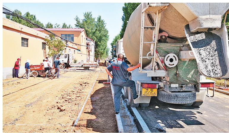
吕村镇东高奇村施工现场

本报讯 在人居环境集中整治中,吕村镇以农村闲置宅基地整治利用作为突破口,采取试点推进、逐步铺开,扎实开展“一宅变四园”行动。