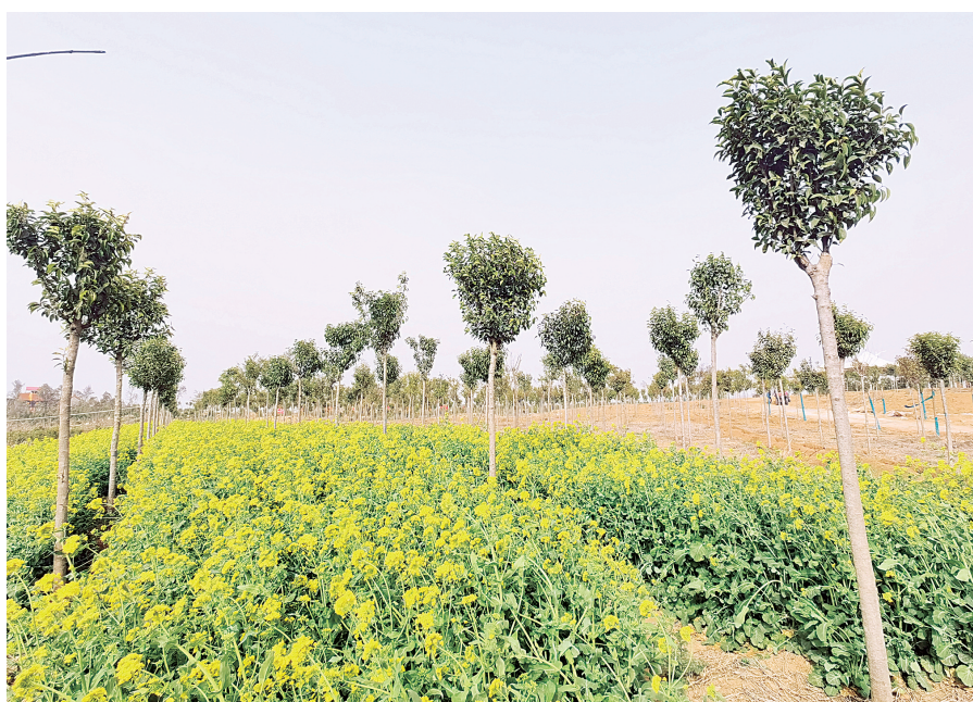
位于韩庄镇的市级义务植树基地

植树造林、增加绿化面积,已成为韩庄镇多年以来持之以恒的常规动作。据统计,今年,该镇投资130余万元,完成南水北调生态廊道绿化造林面积16.93公顷,补植补造4.8公顷,主要栽植大叶女贞、白蜡等绿化苗木;完成城南集聚区道路两侧8.6公顷国储林项目,南张贾村、小庄村、小河村等16个行政村利用村内闲置空地以及田边、路边、沟边等“五边”绿化区域栽植杨树、大叶女贞、白蜡、海棠等绿化园林树种12420余株,绿化面积12公顷;投资200万元,完成康大路、西郊森林公园补植补造46.67公顷,主要栽植油松、雪松、银杏等树种;对辖区孙庄村、三里屯村、庞洼村等11个