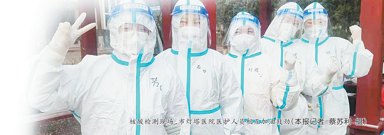
核酸检测现场,市灯塔医院医护人员相互加油鼓劲

慎终如始,则无败事。相信严防死守每一个环节、严格把控每一类风险、疫情防控落实到每一个主体,我们一定能打赢疫情防控阻击战,迎来春暖花开。