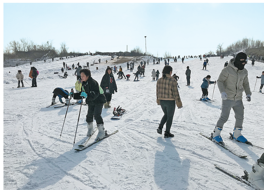
元旦假期,人们纷纷走出家门,许多市民选择前往滑雪场游玩。我市龙安区一家滑雪场迎来客流高峰,游客在这里感受滑雪的乐趣,开启新年运动模式。

会的序幕。随后,在朗读者舒缓而深情的诵读中,一首首引人入胜的诗文、一声声饱含深情的朗诵,《致橡树》《当你来了》《挡不住的青春》展示了辖区居民团结互助、凝心聚力的精神风貌,更展现了东关人意气风发、致知力行的进取风采。本次活动丰富了辖区居民的业余文化生活,为营造良好的文化氛围打下坚实基础。下一步,该街道将持续开展此类活动,将更多更好的优秀文化作品送到群众身边。