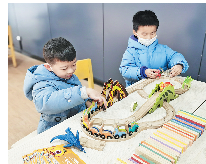
小朋友在参加全脑开发益智玩具体验活动

除此之外,机器人展示活动利用科普资源开拓青少年的视野,提升青少年群体的科学素养,扩大科普覆盖面;少儿跆拳道科普讲座让家长和孩子认识到跆拳道不仅是踢腿打打,通过跆拳道的训练可以养