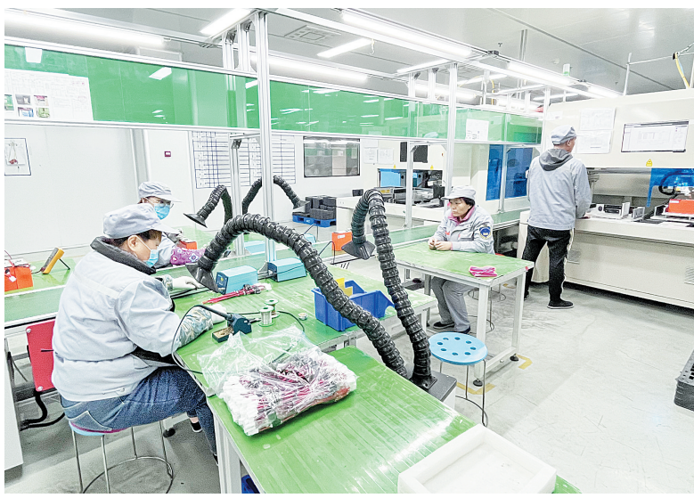
克能能源生产车间一角

今年1月,疫情突袭我市。为解决企业疫情防控的燃眉之急,安阳县(示范区)派专人入住旭阳光电,协调