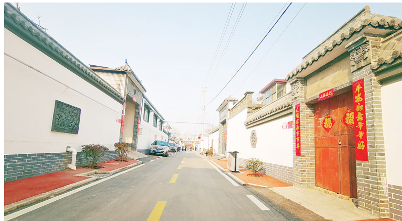
高庄镇胡官屯村一景

村庄的变化有目共睹。胡官屯村全面提升人居环境水平,铺设柏油路面5000多米,疏通双向排水沟3000余米、单向排水沟2000余米,修整残垣断壁18处,新建“一宅四园”3处、文化广场1处、体育广场1处、停车场2处,使村庄更加美丽宜居。“村里过去乱七八糟,俺都不想出