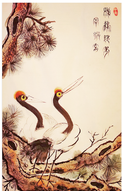
松鹤延年(国画) □群波 作