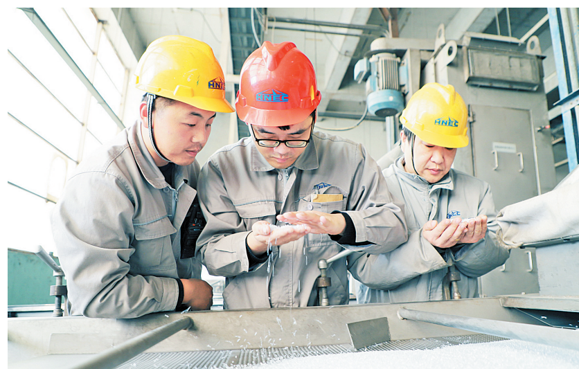
工艺人员正在检查聚酯产品质量

本报讯(记者 马原 通讯员 王晓军)2月6日,记者从安化集团安阳龙宇新材料公司(以下简称安化龙宇新材料)获悉,生产瓶级聚酯切片2.53万吨,同比增长27.8%;营业收入实现1.53亿元,同比增长17%;实现利润63万元,实现生产经营首月开门红。