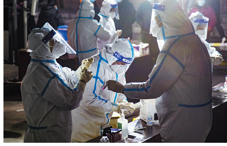
与时间赛跑

每一次实验都是一次与病毒的正面交锋。直接检测病毒标本,检验人员不仅要战胜心理上的恐惧和压力,还要承受长时间穿戴防护装备的不便,不喝水、不吃饭、不去厕所,持续工作几个小时后全身僵硬,脖子累得发酸,手经常抽筋……但检测工作从未