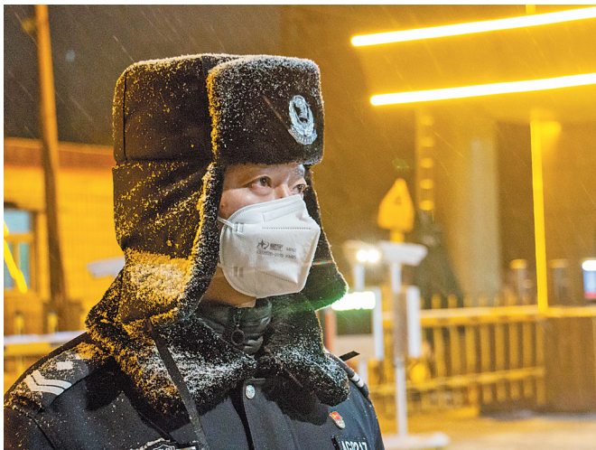
风雪中坚守