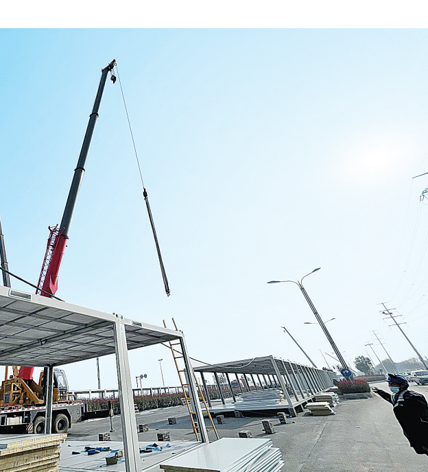
建设中的安阳方舱医院

一系列紧密部署的部署,见证时间赛跑的速度;一系列务实有效的举措,彰显与病魔较量的决心……沉着应战的履职和担当,为我市疫战中起了主动,赢得了先机。