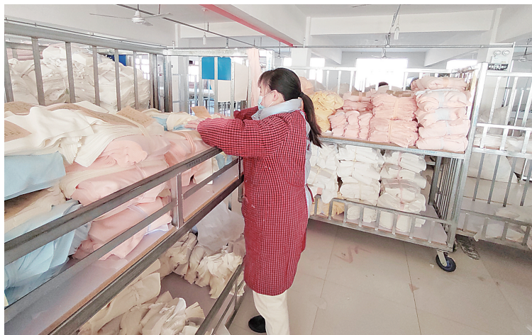
工人正在有条不紊地进行生产

近年,我市北关区整合区域内资源,鼓励纺织服装行业“个转企”“小进规”,在产业链延伸、自主创新、品牌培育、整合重组、人才支撑等方面给予重点