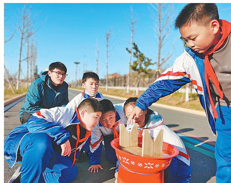
12月21日,在红旗渠精神营地,林州市市直第七小学五年三班学生开展实践体验活动,利用当年红旗渠工地上使用过的土制水平仪“水鸭子”测量水平。近期,红旗渠精神营地研学活动开展得如火如荼,丰富多彩的活动深受中小学生们喜爱。

据了解,河南红旗渠(集团)有限责任公司是林州文旅产业投资开发建设平台。该公司打造的苍溪花街以美术写生为主题,通过与国内高端艺术机构和餐饮公司合作,形成了苍溪美术馆、苍溪艺术画廊以及小吃街、苍溪四季酒店四大板块。苍溪花街现已成为石板岩旅游地标性建筑,对带动全市全域旅游发展、推动石板岩写生特色产业具有重要意义。