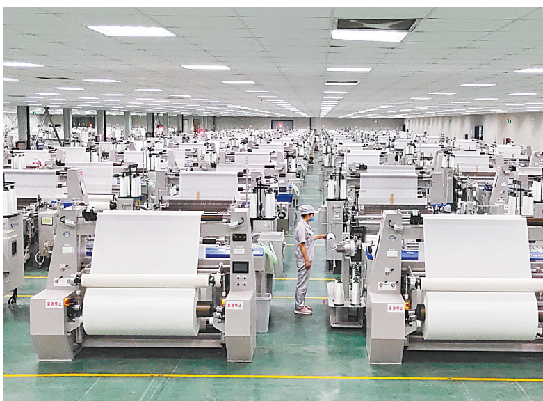
光远新材电子玻纤生产线

作为安阳市的工业重镇,陵阳镇始终牢记发展定位,勇担发展重任,坚持“项目为王”、企业为先,把服务企业和项目作为重点之重点、中心之中心,坚决做到“无事不扰、有事解决”“说到做到、服务周到”。