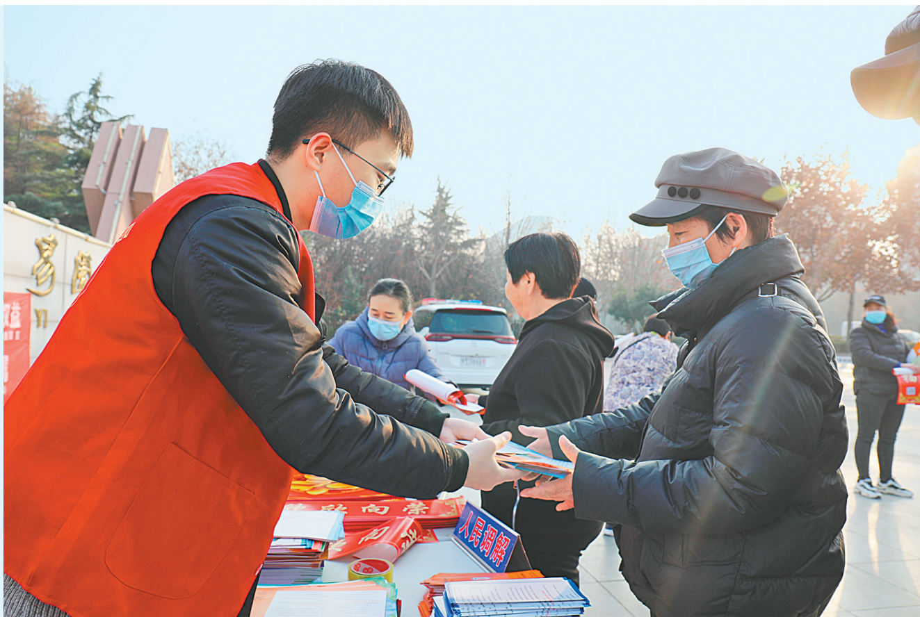
→12月9日,文峰区司法局在易园西门开展“三零”创建暨法律援助法宣传活动。活动现场,工作人员通过摆放宣传展板、悬挂横幅、发放宣传资料等方式,向群众宣传“三零”创建、法律援助等知识,现场为群众讲解“三零”创建的内涵、意义,提供法律咨询,普及法律知识,引导群众自觉遵守法律法规,形成办事依法、遇事找法、解决问题用法、化解矛盾靠法的法治氛围。