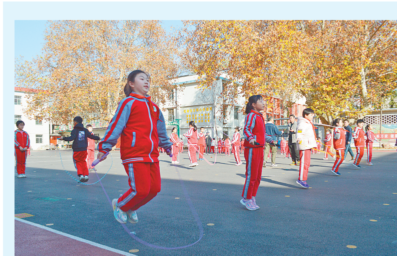
为更好地促进学校精神文明建设,提高学生体质,11月25日下午,市钢城小学举办了单人跳绳比赛,一年级至六年级初赛优胜者参加了本次决赛。天气虽然寒冷,但学生全力拼搏,展示了自己最棒的一面。图为比赛现场。