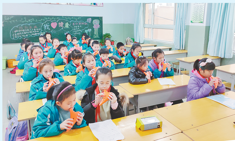
“双减”政策实施后,市铁西路小学提供吹陶笛等丰富多彩的课后延时服务,让学生在学文化知识之余培养个性特长,增强表现能力。开课两个月来,该校学生渐渐爱上了陶笛,从中收获了自信与快乐。图为11月29日,该校学生在延时课上学习吹陶笛。