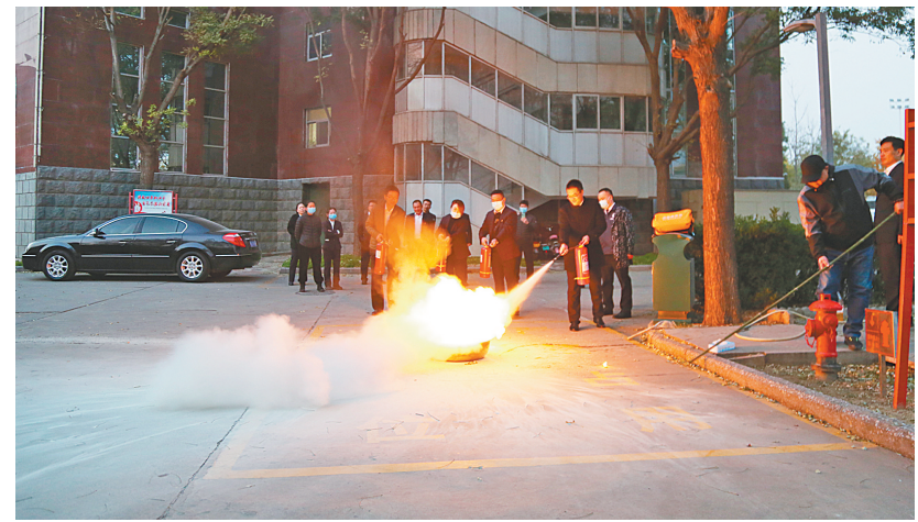
消防演练现场

本报讯 为认真落实“119消防宣传月”要求,切实提高员工消防安全意识,正确预防和应对各种突发事件,保障全员人身安全及单位财产安全,近日,安阳商都农商银行开展了“119主题消防月”暨安全保卫专题培训。培训以视频方式举行,辖内各支行安全员及机关各部室人员参加了此次培训。