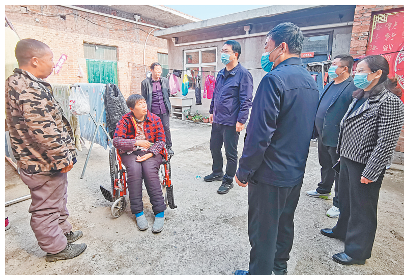
韩庄镇领导走访脱贫户

巩固拓展脱贫成果,做好乡村振兴有机衔接,重点是提高村集体经济收入和脱贫户的“造血”功能。今年年初以来,韩庄镇强力推进项目建设和灾后重建、金融扶贫工作,加大人