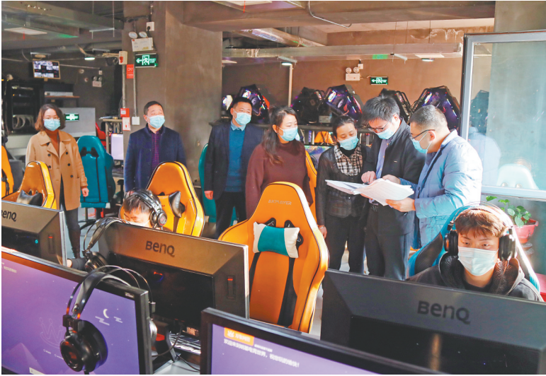
内黄县疫情防控指挥部督导组检查组人员正在对网吧进行检查

施。疫情防控工作开展以来，内黄县委、县政府牢牢把握“生命重于泰山，疫情就是命令，防控就是责任”的总体要求，坚守疫情防控“最后一公里”，把精准防控工作落深、落细、落实。县疫情防控指挥部坚持每天8时召开工作例会，只讲问题不说成绩，对前一天工作中发现的问题进行集中汇研，制定整改措施，提出整改期限，对当天工作进行安排部署。各乡镇、县直各单位第一时间印发疫情防控指南，张贴安民告示，各行政村、社区在显著位置悬挂疫情防控宣传标语、