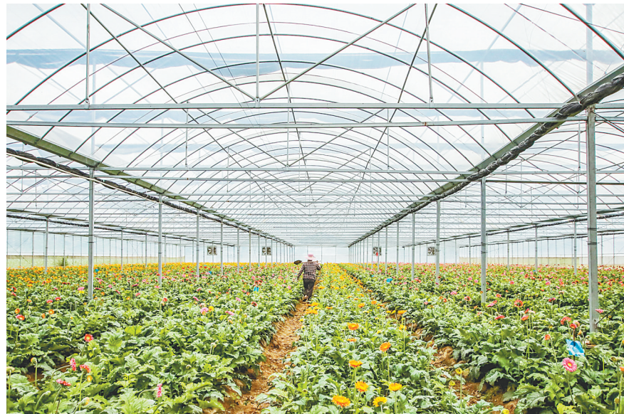
小河村花卉种植大棚(资料图)

近年,该镇投资4460万元,完成康洼、武洼等10个人居环境标兵村建设。投资500万元实施李家湾村村容村貌提升工程。统筹推进西部25个村的