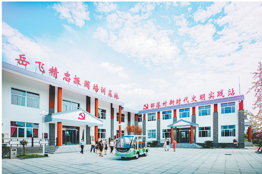
岳飞精忠报国培训基地(资料图)

全国文明城市、国家卫生乡镇、河南省第一批美丽小镇、河南省特色生态旅游示范镇、河南省健康乡镇、河南省党员教育培训示范镇、安阳市先进基层党组织、安阳市抗击新冠肺炎疫情先进单位……一系列荣誉和品牌,奏响了美丽韩庄的最强音。如今的韩庄镇,天更蓝、水更清、村更富、城更美,一幅欣欣向荣的美丽乡村画卷正在该镇65平方公里的大地上徐徐展开。