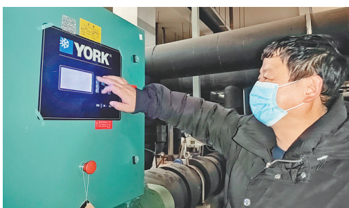
工作人员检查污水源热泵系统