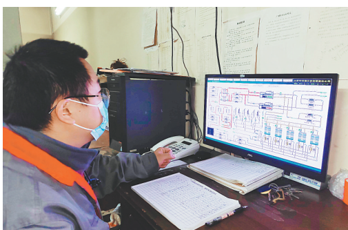
工作人员在电脑前监控污水源热泵系统

此外,在我市还有不少用电、用气取暖的群众。“我家主要靠空调和小太阳电暖器取暖,一个供暖季下来花费不到两千元钱。现在许多家用的取暖设备都是节能环保型的,耗电量并不大。”殷都区西郊乡丰安村一位村民告诉记者。记者了解到,在龙安区与北关区等未纳入集中供热管网的村庄,群众多是用电或天然气取暖,政府会给群众每户发放500度电的消费补贴,针对困难群体给予1000度电或1500度的补贴,非集中供暖区域应系统,涵盖到所有居民。