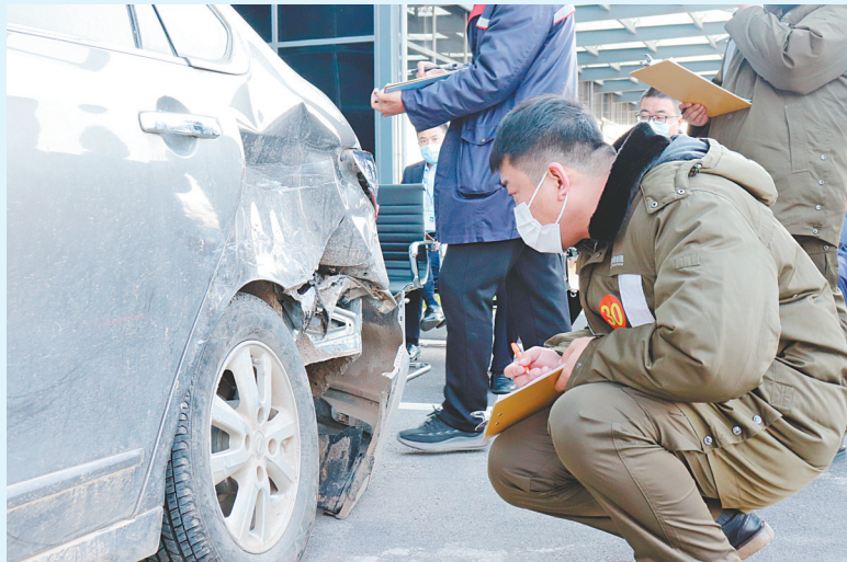
组图为技能竞赛现场