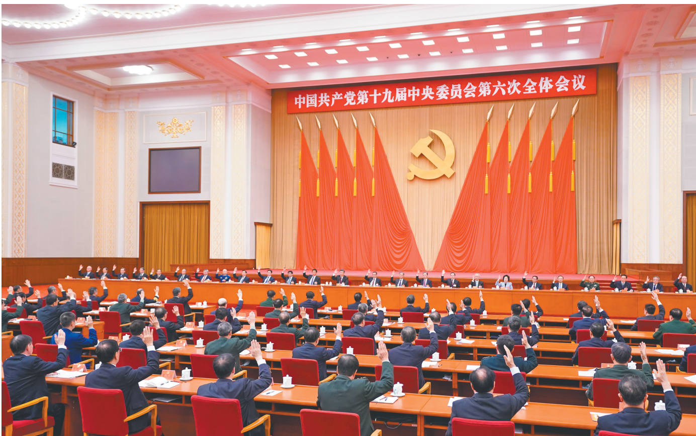
中国共产党第十九届中央委员会第六次全体会议,于2021年11月8日至11日在北京举行。中央政治局主持会议。