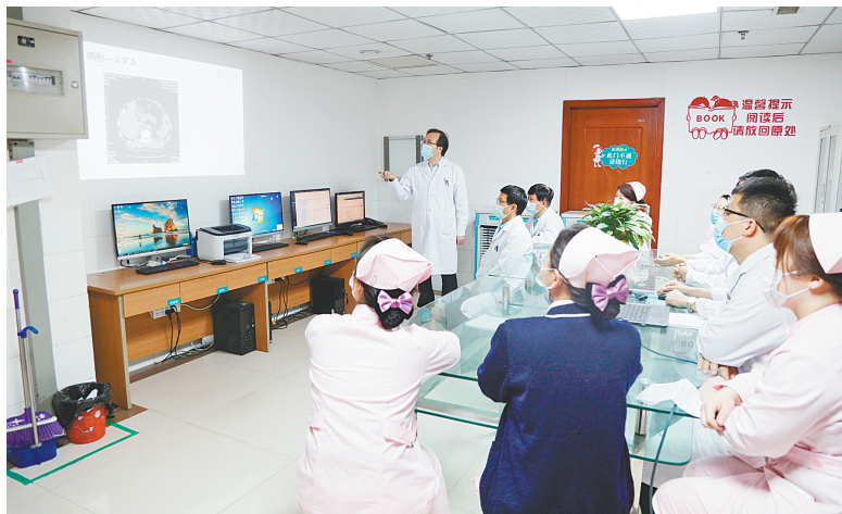
泌尿外科团队正在探讨病例