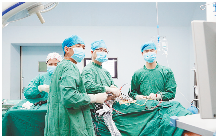
泌尿外科团队正在进行手术