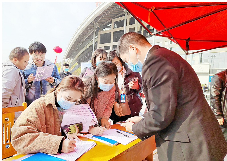
“涇泉涌流”枣乡内黄人才活动周活动现场,求职者在用人单位展位前登记、咨询

据了解,“涇泉涌流”枣乡内黄人才活动周于10月25日至10月31日举行,线上线下人才招聘活动同步启动。活动周期间,内黄县还将组织开展大学毕业生参观企业、引进人才体验周转房等活动,举办乡土人才专题培训、技能大赛等,进一步为内黄县招才引智工作注入强劲动力。据统计,