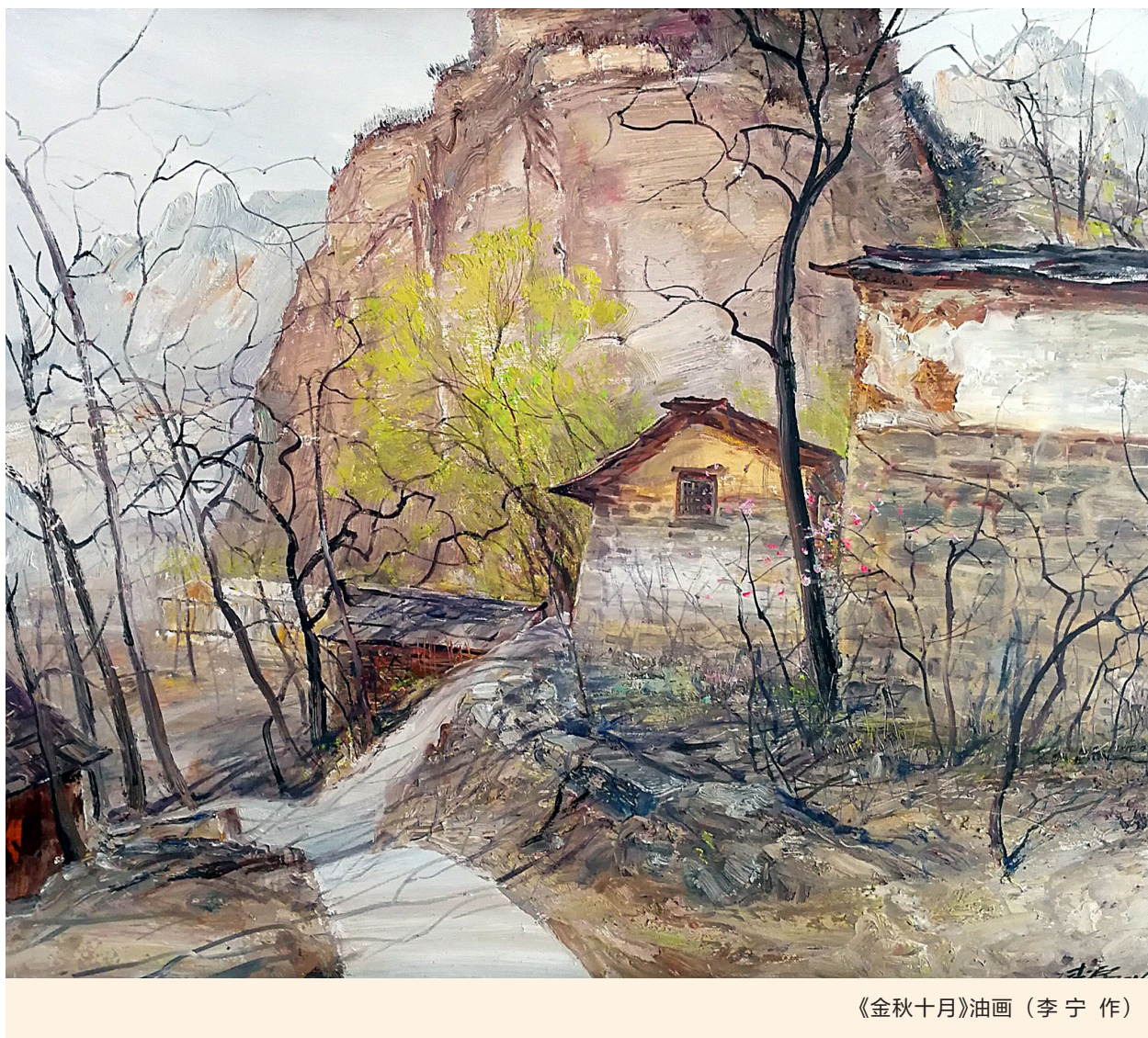
《金秋十月》油画 (李宁作)

人无精神不立, 国无精神不强。精神是一种思想信仰, 一种价值理念, 一种人生态度, 一种气概情怀, 一种文化传承。只要我在岗位上充满热情, 在岗位上谨记忠诚, 以责任为担当, 以奉献去践行, 一样可以化作萤火, 划开无际的黑夜; 一样可以化作清风, 吹来远方的馨香; 一样可以化作细雨, 滋润人们的心田; 一样可以在平凡的岗位上不断追求卓越, 用执着和汗水唱一首时代的赞歌!