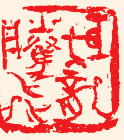
祖国万岁 巨龙腾飞 李现军篆刻