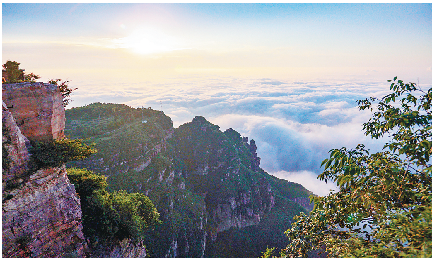
太行朝晖

据资料表明,白鹭对生存之环境条件要求极高,非气候之适宜、水质之良好、林草之繁茂、食物之充足而不择。近年,诸白鹭之所以迁徙斯地,无须赘言。