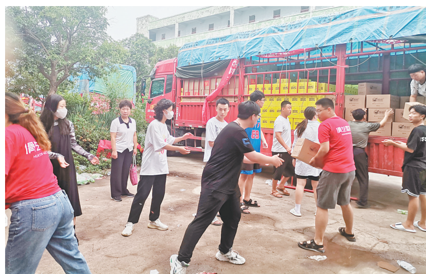
市妇联工作人员在搬运捐赠物品

为接收分发好救灾物资,市妇联成立了救灾物资接收组、调配组、宣传组,建立了工作群,每天对各县(市)区受灾情况进行精准统计,对接接收物资进行合理调配,24小时工作不间断,确保了防汛救灾工作的时效性和精准性。据初步统计,目前已累计接收10万件以上救灾物资,并迅速发放到受灾妇女儿童