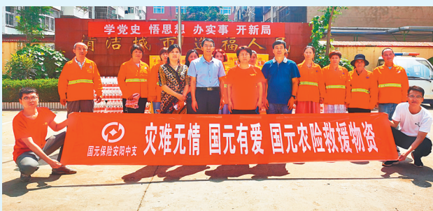
7月26日上午,安阳市保险行业协会负责人与国元保险安阳中支相关领导前往殷都区环卫处,慰问奋战一线的环卫工人。