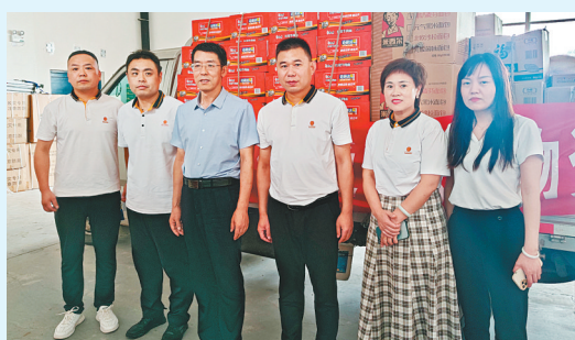
7月28日下午,安阳市保险行业协会负责人和阳光人寿安阳中支相关领导到瓦店乡受灾安置点捐赠救灾物资。