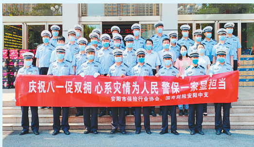
8月1日,安阳市保险行业协会负责人、国寿财险安阳中支副总经理一行到市公安局交通管理支队走访慰问。

风雨无情,险企有爱。7月21日以来,全市各保险机构第一时间启动重大突发事件应急预案,或成立理赔服务工作小组,或组织救援力量开展现场救援,以实际行动彰显责任与担当。