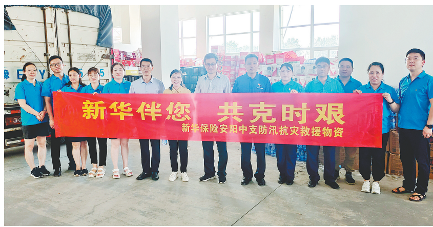
新华保险安阳中支捐赠物资现场

全市各财险公司迅速启动应急值班制度,所有员工坚守岗位,24小时待命;组织理赔部门全员、全车出动,展开24小时紧急理赔救援,深入受灾企业、居民小区和严重受灾路段,进行救援和查勘。同时,各保险公司提供应急救援服务,通过加强与4S店、汽车维修厂沟通协调,及时出动救援车辆对水淹车辆进行拖车救援。此外,部分总公司、省公司领导亲临安阳现场指导,协调其他省、市公司调配人力物力来安阳