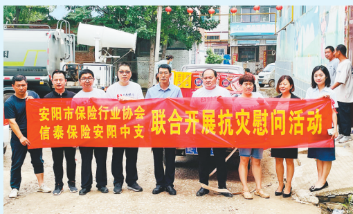
7月28日上午,安阳市保险行业协会负责人和信泰保险安阳中支相关领导到高压镇汪流村,为村民送去生活用品。