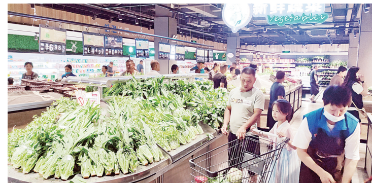
超市内各类蔬菜供应充足

市商务局有关负责人介绍:“从督导检查的情况看,我市各类生活必需品供应充足、价格稳定,未出现抢购和哄抬物价的情况。尽管暴雨影响到商超的物流运输,但他们都有较充足的备货,不会对近期的供应造成影响。目前,我市城区生活必需品市场供应情况稳定,粮油肉蛋菜供应充足,个别地区蔬菜价格略有上涨,没有发现商超集中抢购的现象。受积水影响,为保障群众消费安全,文峰区6家华联、2家丹尼斯和部分地区商超暂时歇业,清理积水。积水清理后,商超保供情况可以得到保证。市商务局将密切关注商超积水清理,帮助其尽早开业,并持续对我市主要商超的防汛和市场供应情况进行督导和监测,加强调度,确保汛期我市生活必需品的稳定供应。”