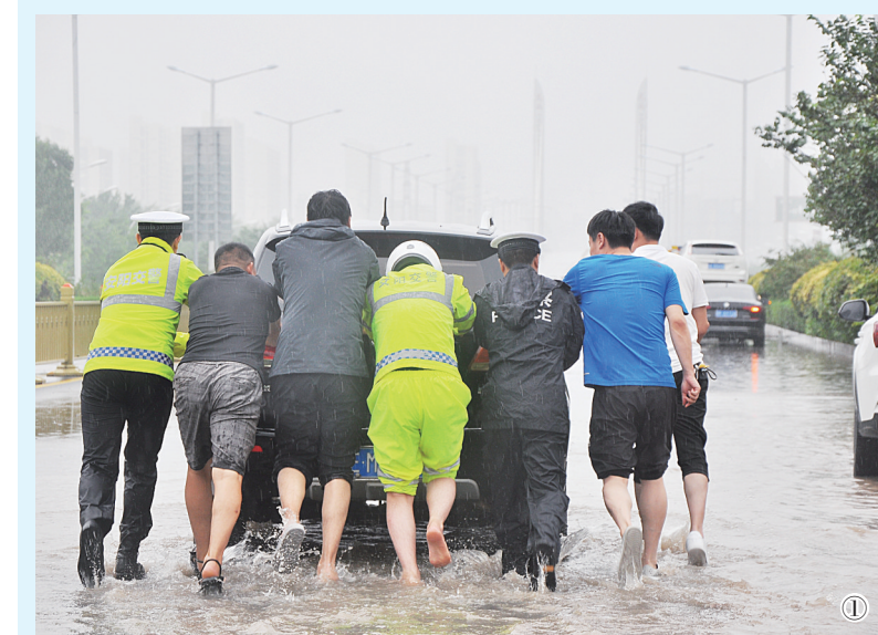
图①为交警在光明路文峰大道路口帮助群众推车。